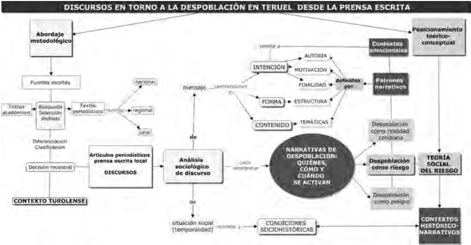
Figura 1. Abordaje metodológico y posicionamiento teórico-conceptual

turolese, nos animó a focalizar nuestro estudio en esta provincia que se conformaba como un adecuado escenario de análisis, de hecho algunos investigadores la habían calificado como "uno de los paradigmas de los procesos de despoblación para los investigadores de todo el mundo" (Escalona, El Periódico de Aragón , 5/4/2003) 2 . Ciertamente este territorio es uno de los que está testimoniando (junto a otras zonas del interior peninsular español) uno de los procesos mayores de vaciamiento demográfico en el contexto europeo desde los años 50 del siglo pasado. Igualmente se ha ceñido el objeto de nuestro análisis central al periodo 2008-2015 por ser definido por los actores sociales como de "crisis demográfica"; estaríamos ante un punto de inflexión, que no obstante muestra continuidades en la historia reciente del relato de la despoblación.